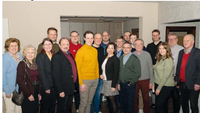
Vorstand CDU-Gemeindeverband Hasbergen