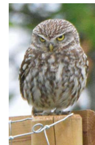
Steinkauz am Wiesentalweg

der Streuobstwiese installiert. Nun hoffen die Genossinnen und Genossen darauf, dass die Nistkästen von den Steinkauzpaarchen gut angenommen und mit etwas Glück auch Jungvögel darin aufgezogen werden können.