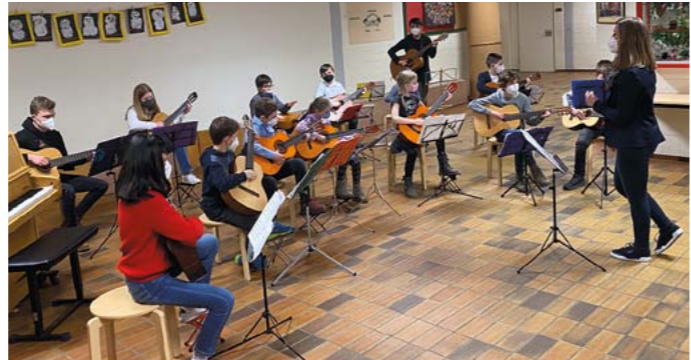
Das Hasberger Gitarrenensemble in voller Besetzung