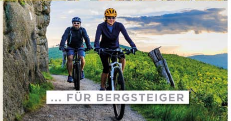
... FÜR BERGSTEIGER