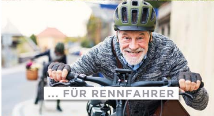
... FÜR RENNFAHRER