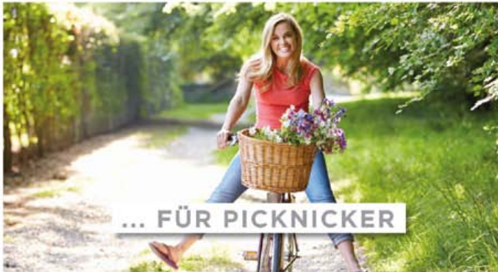
... FÜR PICKNICKER