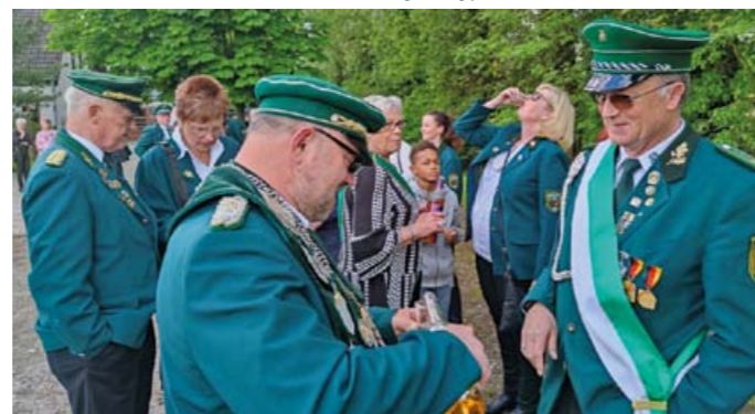
Umtrunk mit dem noch amtierenden Schützenkönigspaar